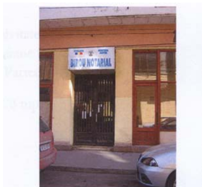
Intrarea de pe strada Vasile Lascar

Suprafața utilă totală este de 47,79 mp, cota de teren în indiviziune fiind de 6,98 mp.