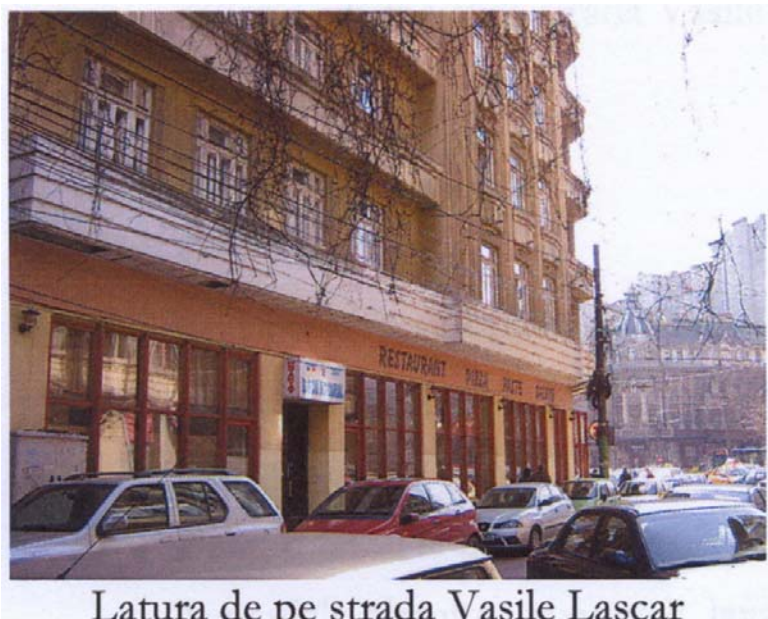
Latura de pe strada Vasile Lascar